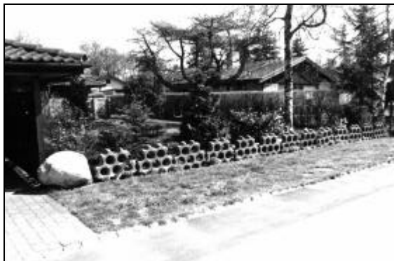
April 1995. Solvænget 20. Eksempel på anvendelse af "rullebanefliser".