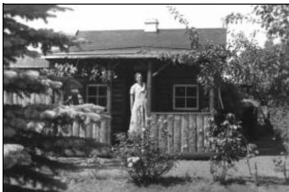
Solvænget 13 ca. 1935. Erling Agnilds mor i sommerhuset.