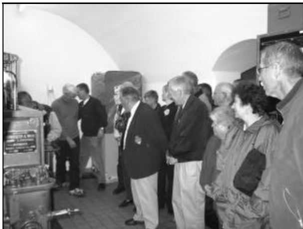
Maskinrummet med en af de gamle (1953) dieselmotorer fra B&W.

Fotografierne er alle fra perioden maj 1940 til maj 1941. Mange af fotografierne er fra Dragør fort, men der er dog også fotografier fra Kongelundsfortet og fotografier fra omegnen af fortene. Nogle af